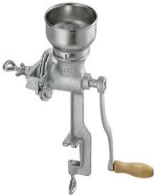
Gambar 2.2 penggiling beras manual

Keuntungan menggunakan mesin penggiling beras manual adalah: