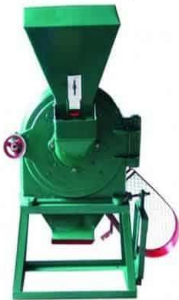
Gambar 2.3 bentuk mesin yang di rancang

Dari beberapa tahapan yang telah dijelaskan diatas maka penulis memilih konsep rancangan di bawah ini.