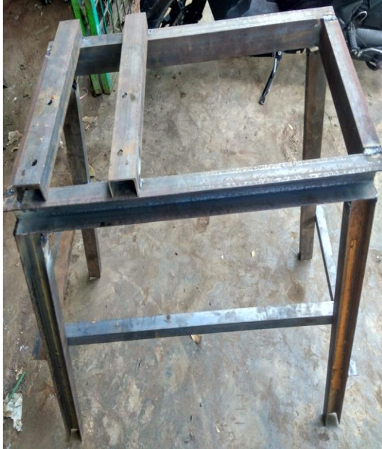
Gambar 2.5 Desain kerangka mesin yang dirancang

Kerangka terbuat dari profil “U5” yang berfungsi sebagai tempat duduk mesin dan setiap komponen rancangan yang ada di atasnya. Material ini mudah didapat dan praktis pengaplikasiannya.