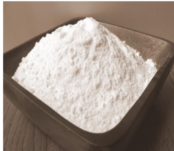
Gambar 2.1. Tepung beras

Tepung beras bisa digunakan untuk membuat berbagai macam makanan, tepung beras dibuat dengan cara menggiling beras putih sampai tingkat kehalusan tertentu. Biasanya tepung beras digunakan dalam pembuatan kue tradisional, yang kebanyakan merupakan kue basah, seperti nagasari, lapis, dan sebagainya. Akan tetapi saat ini tepung beras sering digunakan untuk membuat cake atau kue kering bahkan sebagai adonan campuran makanan gorengan. Kue kering dan makanan gorengan yang dihasilkan tepung beras teksturnya lebih renyah, sedangkan cake tepung beras teksturnya lebih padat jika dibandingkan dengan cake dari tepung terigu. Hal ini disebabkan karena kandungan lemak dan protein tepung beras lebih rendah dibandingkan tepung terigu (Ida, 2008:43).