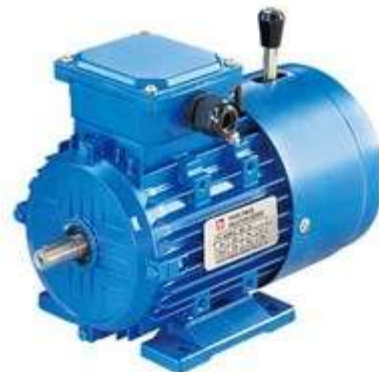
Gambar 2.6 Motor Listrik

Motor berfungsi untuk memutar poros pemutar mesin pengupas dan sumber penggerak utama dalam proses pengupasan kulit ari biji kopi.