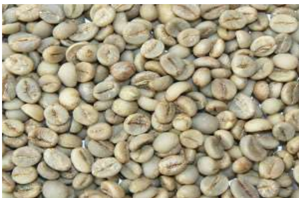
Gambar 2.4 Biji Kopi Yang Masih Berkulit Ari

2.Pengolahan basah kopi dari kebun dipisahkan yang masak, yang hijau dan yang kering, seperti terlihat pada Gambar 2.4. Kopi yang masak itu kemudian dimemarkan dengan cara ditumbuk dan sebelum di tumbuk dibasahi dahulu untuk memudahkan pememaran, setelah kulit terlepas, biji-biji kopi direndam dalam air selama 3-6 hari. Sesudah itu biji kopi yang masih berkulit ari dibersihkan lalu dijemur, setelah kopi kering kemudian di tumbuk lagi agar kulit arinya lepas, lalu ditampi, seperti terlihat pada