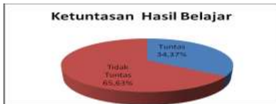
Gambar 1. Ketuntasan Belajar Pada Pre Test

Berdasarkan hasil pretes pada tabel diatas bahwa dari 32 siswa yang mengikuti pretes, 11 siswa atau sekitar 34,37 % yang mencapai ketuntasan dan 21 siswa atau sekitar 65,63 % belum mencapai ketuntasan. Hasil ketuntasan belajar pada pre test dapat digambarkan pada diagram di bawah ini: