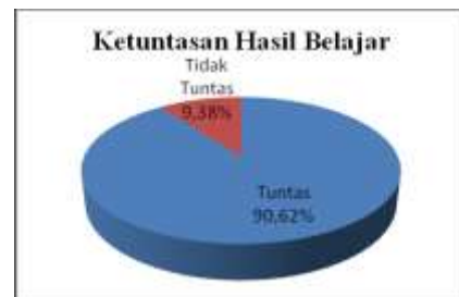
Gambar 1. Diagram Ketuntasan Hasil Belajar Pada Siklus I

Berdasarkan hasil tes siklus I pada tabel diatas bahwa dari 32 siswa yang mengikuti tes awal, 29 siswa atau sekitar 90,62 % telah mencapai ketuntasan. Sedangkan siswa yang belum mencapai ketuntasan yaitu sebanyak 3 siswa atau sekitar 9,38 %. Ketuntasan belajar pada tes siklus I dapat digambarkan pada diagram di bawah ini: